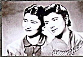
Moravští Romové, budoucí vzhľad CT Hodonín