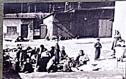
Hodonín, vzhľad „cikánskeho“ tábora po príchodu

Výtah z Domácího řádu CT Lety, který platil do 30. 9. 1942.