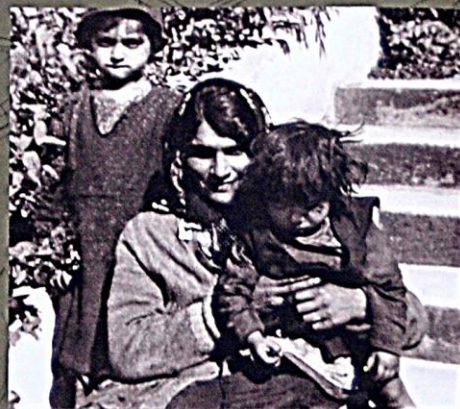
Vzhľad CT Hodonín

Výtah z Táborového řádu, který platil v CT Lety a Hodonín od 1. 10. 1942.