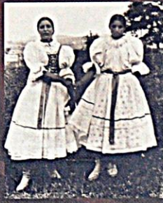
Romské dívky z Moravského Slovácka, Kněždub, okr. Hodonín, kolem roku 1900

Ono se řekne Cikán, ale jacy my sme byli Cikáni? My sme nežili cikánským způsobem, ale jako ostatní lidé. Nechtěl se chlubit, ale malinkatá děve uměla tak vyřítat slovácké výřky jako já. Po vyřít školky jsem šla sedm let ve Slovači v Uherškém Hradišti. (A. CH., * 1913, Z4938)