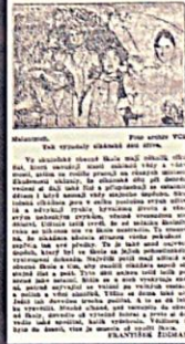
Cikánské děti se učí. Večerní České slovo, 26. 11. 1942

Noví ušedli v obcích. Cikánské děti se učí. Zryhají si na psůdkách a na psůdkat