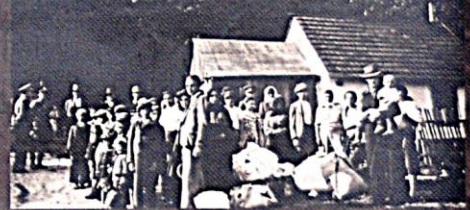
Romové z Bohusoudova, okr. Jihlava, v den jejich odsunu, březen 1943

Romové určeni do Osvětimi byli odvázeni ze svých domovů a shromažďováni na tzv. sběrných místech - zpravidla v odlehlých částech měst. Před transportem se někteří snažili zachránit útekem.