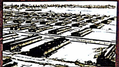
Tábor v Birkenau se rozkládal na ploše 750 x 1 800 m, letecký snímek, 1945

Tábor Osvětim II zůstal v paměti přeživších pod německým názvem Birkenau. Tento tábor byl využíván také jako koncentrační, ale především jako vyhlazovací. Jeden z jeho úseků, označený B II e, sloužil od 26. 2. 1943 do 2. 8. 1944 jako tzv. cikánský tábor.