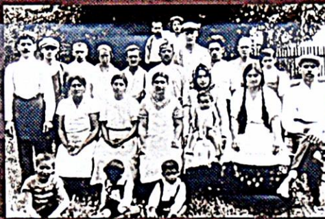
Romové ze Strážnice, okr. Hodonín, kolem roku 1920

Šance na záchranu Romů existovala – za své Romy se mohlo zaručit jejich domovská obec a z transportních seznamů je „vyreklamovat“ – žádat o jejich vylnění. Většina obcí však možnosti nevyžila; takto zachráněni byli jen nepočetní jednotlivci.