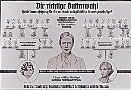
Propagandistický leták „Správná volba partnera jako předpoklad hodnotného a šťastného partnerského soužití. ...Ve tvé volbě leží osud tvého rodu a tvého národa.“

Nacistická věda byla posedlá uplatňováním biologických hledisek, dědičné předpoklady označila za určující pro jednání člověka. Sociální, ale také asociální jevy se vysvětlovaly špatným genetickým základem. „Cikáni“ byli považováni za dědičně, tedy nenapravitelně asociální skupinu lidí.