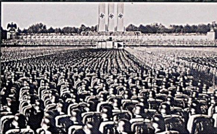
Norimberský sněm, srpen 1935

Zákon na ochranu německé krve a německé cti zakázal smíšené sňatky ohrožující čistotu německé krve. Zakazoval manželství i mimomanželské poměry mezi Němci a příslušníky cizích ras.