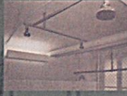
Plynová komora kamuflovaná jako spíչny. V takových zařízeních probíhala na některých psychiatrických klinikách eutanazie slabomyslných, Bernburg

Malchov I. dubna. (la) Orgán SS, das schwarze Korps zahájil novou kampaň za další vybudování zákonodárství o sterilizaci. V sensačním článku zasazuje se tento vlivný list o uzákonění tak zvaného usmrcování z milosti. Nevyléčitelně nemocný nebo jinak úchylný lidé, mají být ve smyslu tohoto nového zákona státním orgánem sprovedeni se světa.