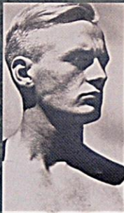
Arionský typ v nacistické rasové propagandě

Základem rasové politiky se staly tzv. norimberské zákony z roku 1935 zaměřené na „ochranu a očištění německé rasy“.