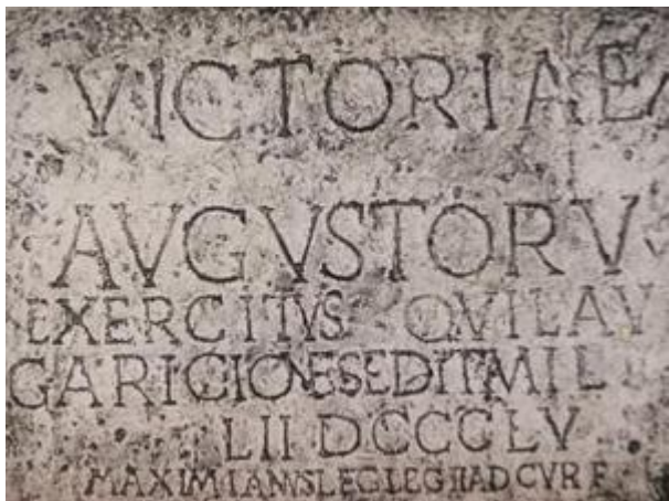
Římský nápis v Trenčíně