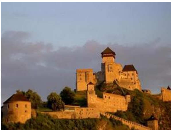
Trenčínský hrad (3. největší hrad na Slovensku)