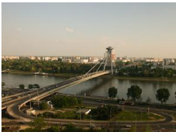
Nový most přes Dunaj v Bratislavě